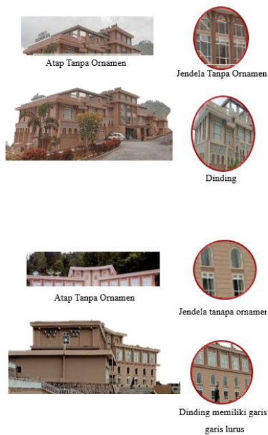
Gambar 5. Ornamen Sebelum Transformasi (Tahun 2017)

Sesudah transformasi, bangunan utama Portola Grand Renggali Hotel Takengon tampil bersih tanpa ada ornamen di bagian dinding, jendela maupun di bagian atapnya, bertujuan untuk memunculkan Kesan modern lebih jelas. Namun, berbeda di bangunan Kedua Portola Grand Renggali Hotel Takengon tampak depan dinding di tambahkan sedikit ornamen berupa garis-garis lurus dengan tujuan memperindah tampilan visual atau memberikan Kesan yang lebih menarik pada bangunan Portola Grand Renggali Hotel Takengon.