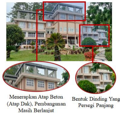
Gambar 2. Bentuk Sesudah Transformasi (Tahun 2025)