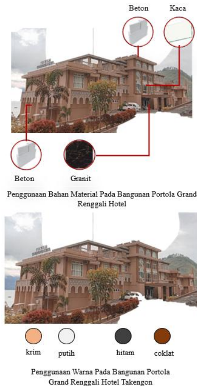
Gambar 4. Material Dan Warna Sesudah Transformasi (Tahun 2025)