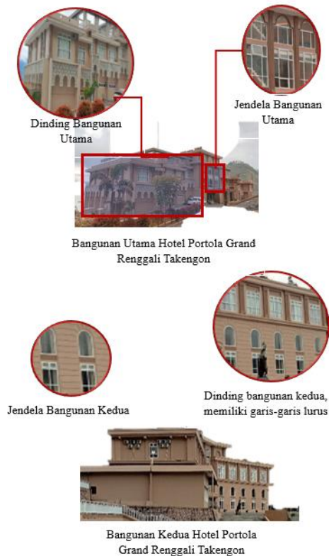
Gambar 8. Fasad Sesudah Transformasi (Tahun 2025)